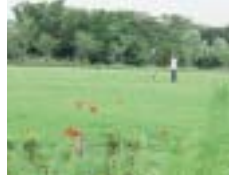
公園内の芝生広場

物ヤード跡地につくられたものです。この公園は、市内の広域避難場所のうち、次のとおりです。 ①大宮交通公園 ②殿田公園 ③梅小路公園 はがきに、クイズの答え。